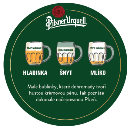
Podtácky v zóne. Hlavný claim a bublinky v pivnej pene spoločne s komunikáciou kvality v súvislosti s bublinkami v pene.