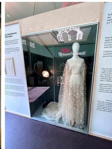
Hlavná zóna Pilsner Urquell s komunikáciou kampaňového claimu. Vpravo: róba z piva Pilsner Urquell s doplnkovými informáciami o procese výroby, vystavená spoločne s kusom látky otvorenej na ohmatanie a otestovanie.