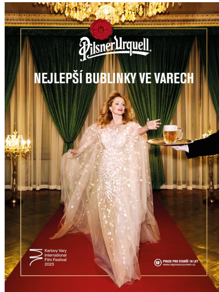
Hlavný kampaňový vizuál po vynesení