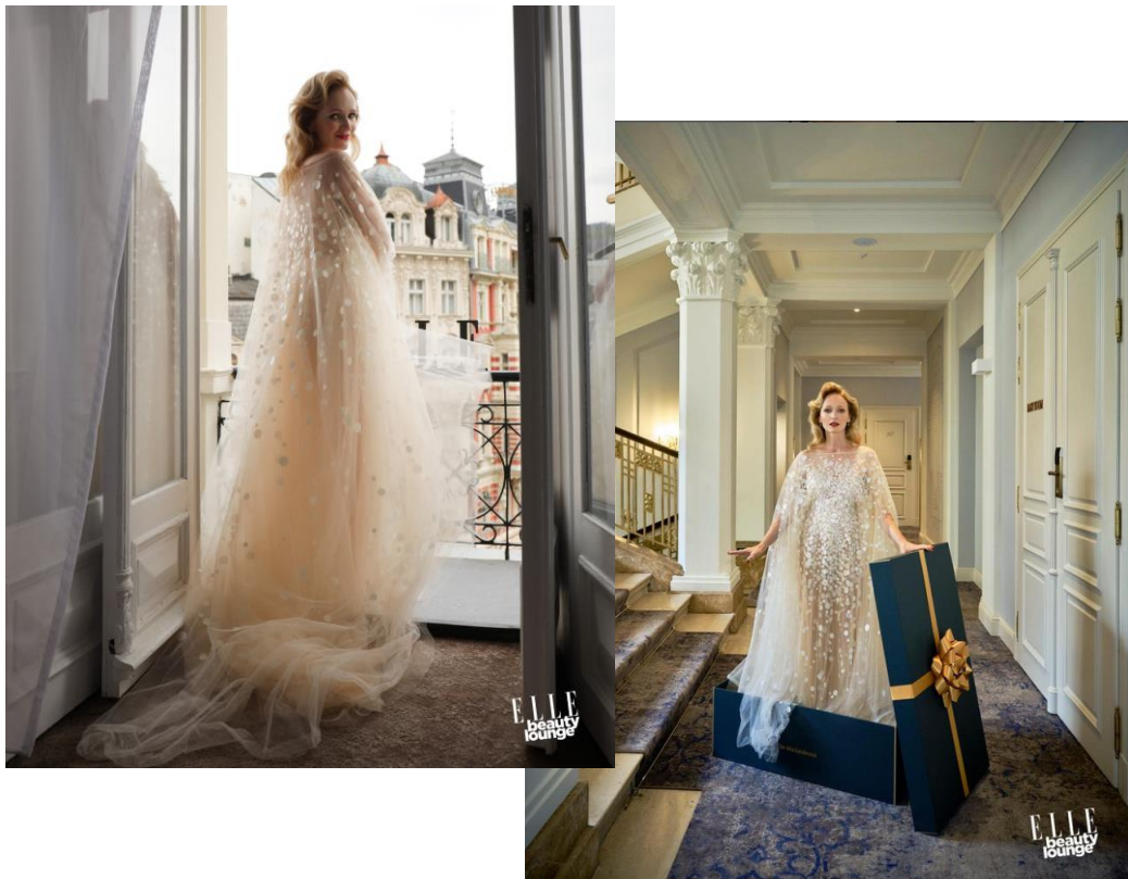
ELLE BEAUTY LOUNGE – statika