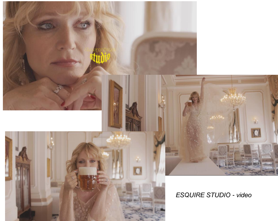
ESQUIRE STUDIO - video