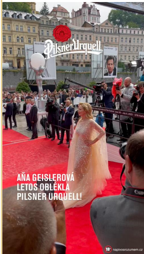
Aňa Geislerová – priamo z červeneho koberca (6s reel)