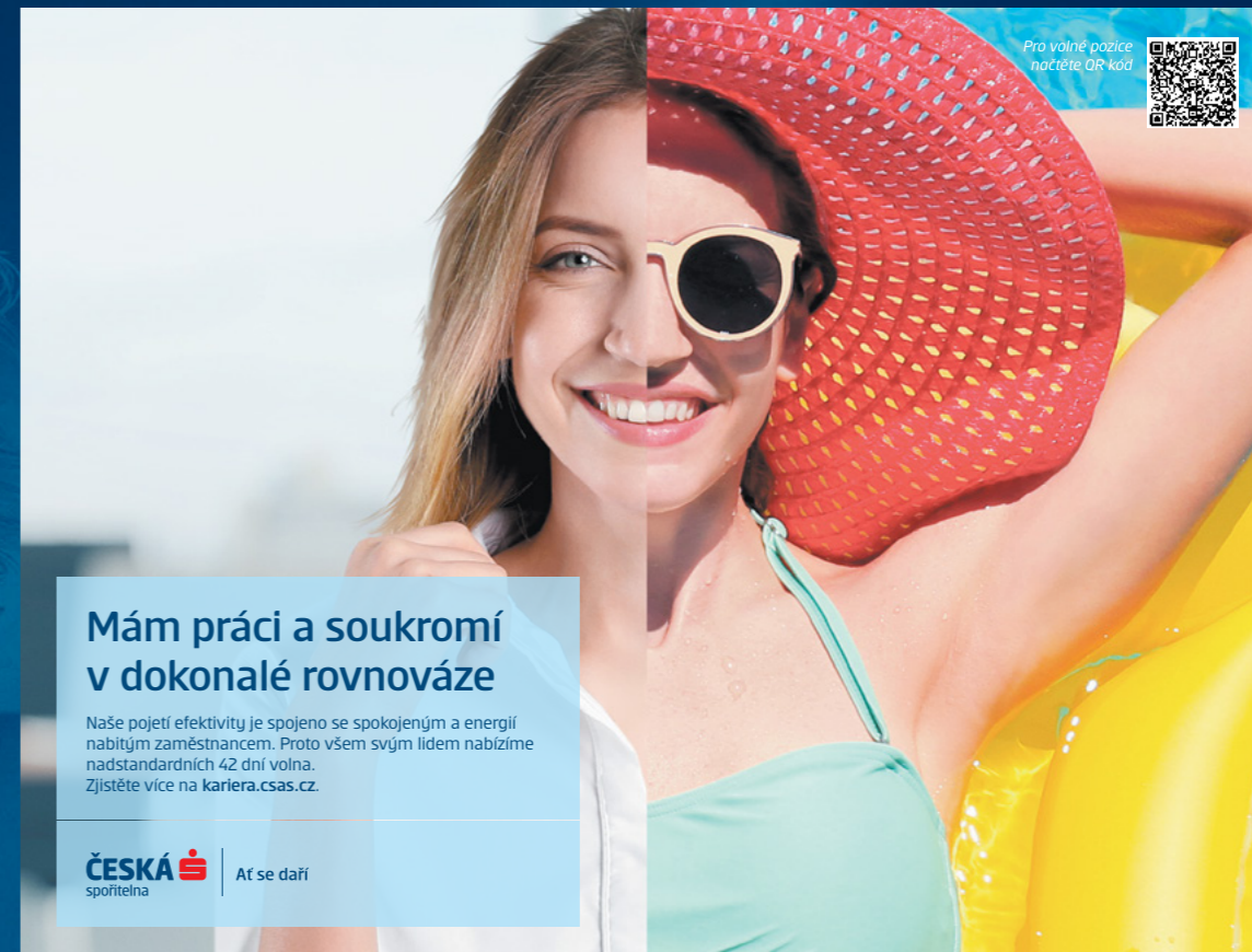
Print 42 dní volna